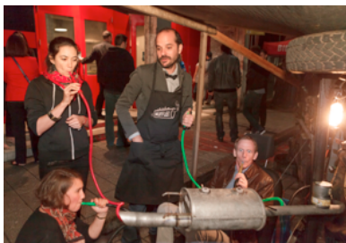
BGL, Chicha Muffler, 2013 © Guy L'Heureux

BGL (Québec) : Chicha Muffler | Installation sur la Place publique