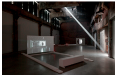
Yam Lau, A World is a Model of the World, 2013

Yam Lau (Toronto) : A World is a Model of the World | Commissaire : Alice Jim | Grande salle