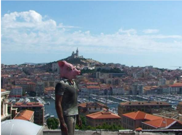
André Fortino, Hôtel Dieu , 2009

L'artiste est à Montréal jusqu'au 8 octobre