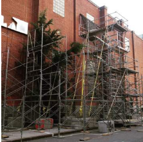
Vue du montage de Mirador , Acapulco

Mirador de Acapulco , un collectif basé à Québec et à Chicoutimi, se révèle sous la forme d'une montagne schématisée, adossée sur une grande surface de l'immeuble face à la Fonderie Darling. Avec son esthétique brute rappelant les chantiers de construction, l'installation, d'une hauteur de neuf mètres, composée d'échafaudages recouverts de divers matériaux de construction, est le résultat d'une réflexion autour du paysage, du factice, des jeux d'échelle et de l'espace public. Mirador souligne, avec dérision, les particularités du contexte urbain et surtout de Montréal et de ses nombreux chantiers de construction.