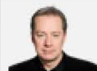
MARIO CLOUTIER LA PRESSE