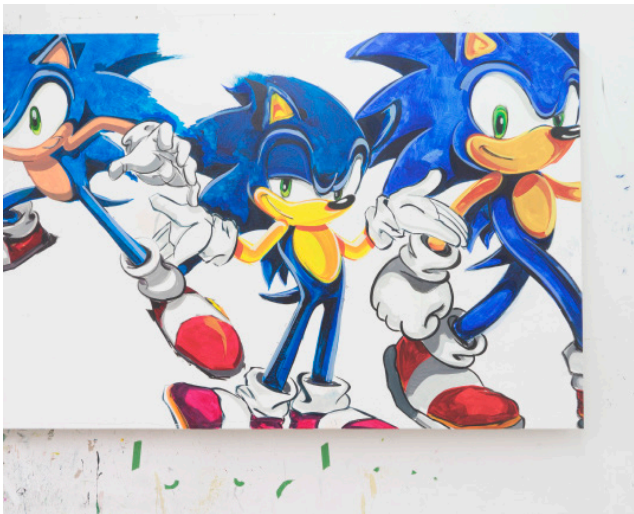
Vincent Larouche, A Study In Motion , 2020