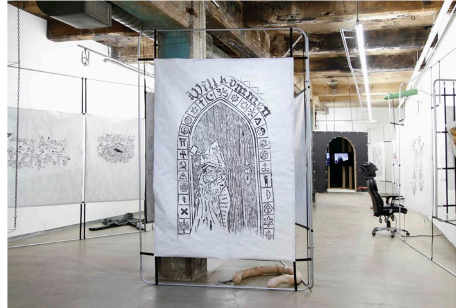
Je suis , 2020. Vue d'exposition à la Fonderie Darling