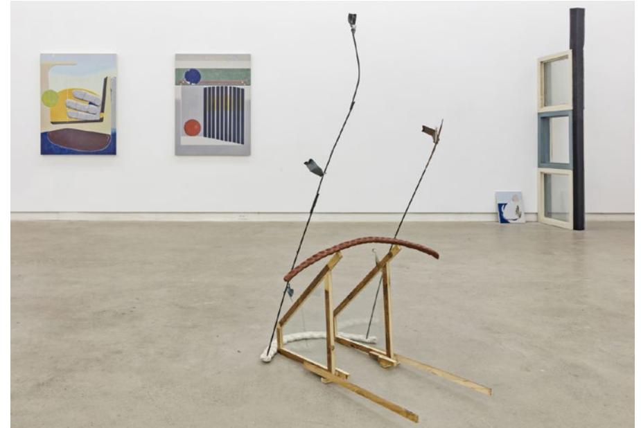
Thirsty Things, 2019. Vue d'exposition à la galerie Clint Roenisch.