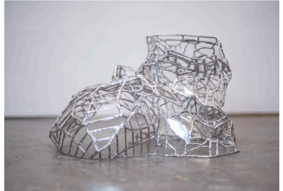
As Chalk and Cheese, 2018. Vue d'installation à crutch CAC.