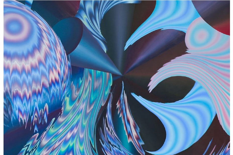
Still Waiting News, 2019. Détail.