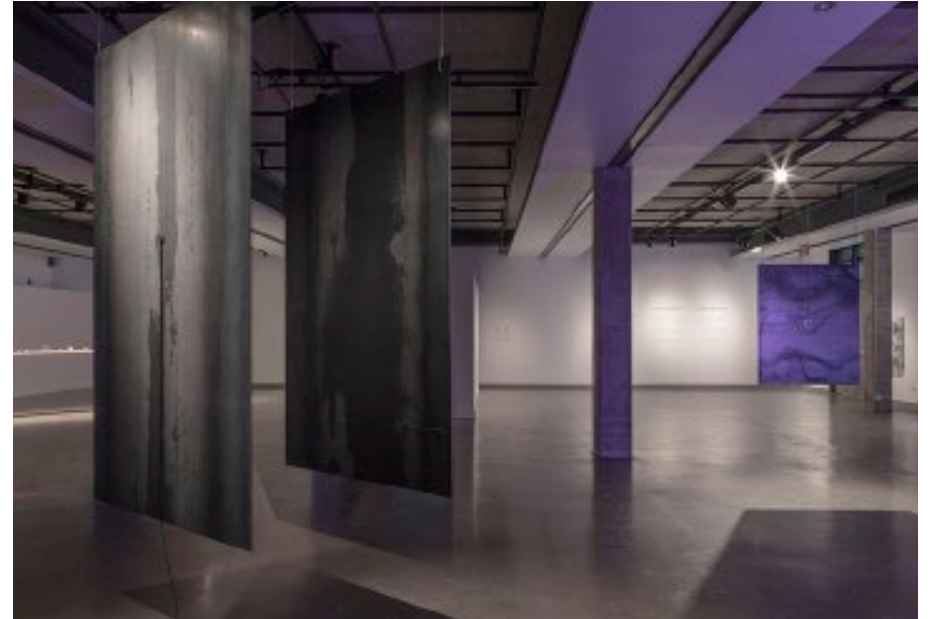
In-ouïe (unheard), 2019. Vue d'installation, Centre d'Exposition de l'université de Montréal