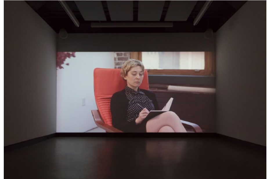
Doublures , 2019. Vue d'exposition au centre Dazibao © Marilou Crispin