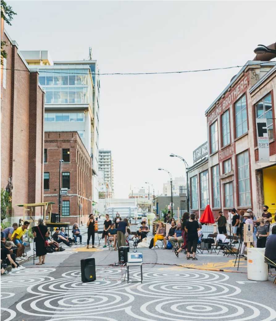
Performance de Nadège Grebmeier Forget, Place Publique, 2020