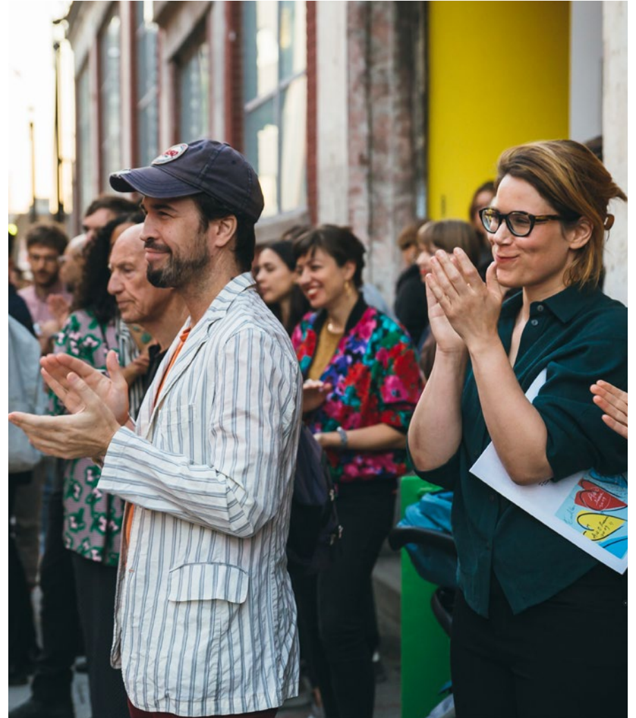
Allocutions lors du vernissage d'automne, 2019