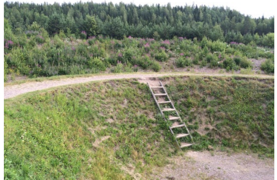
Stairs book project, 2017.