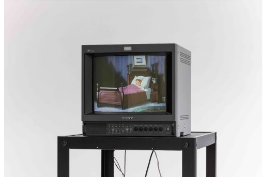
COMÉDIE, 2020. Vue d'installation à Cassandra Cassandra © Laura Findlay