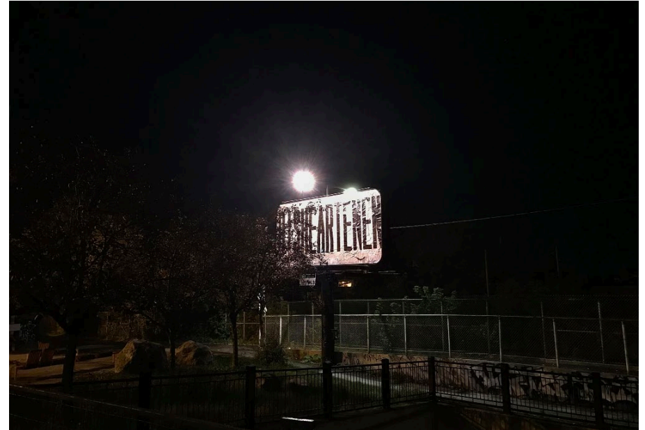
Jean Couteau Collective, Disheartenen , 2020